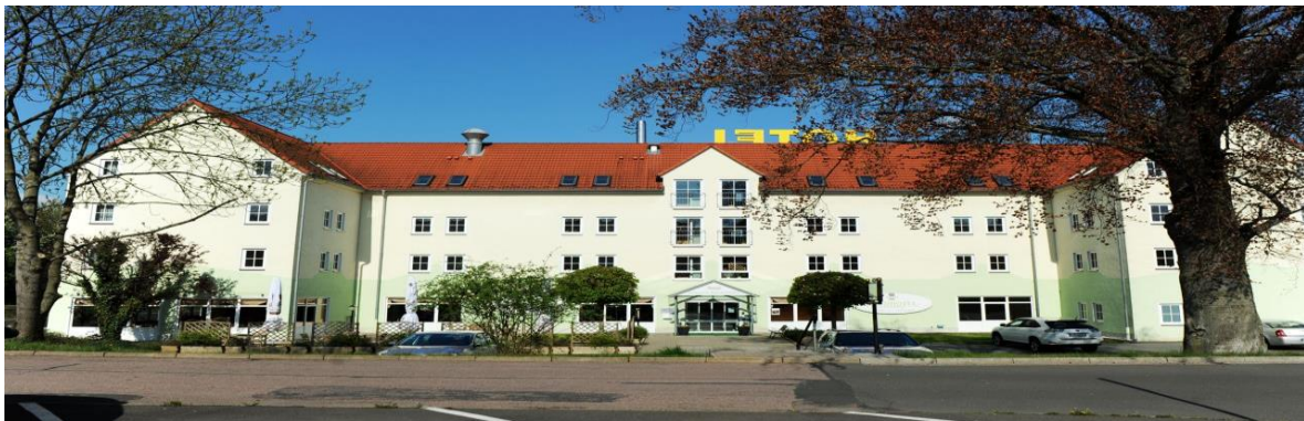
AKZENT Hotel Frankenberg